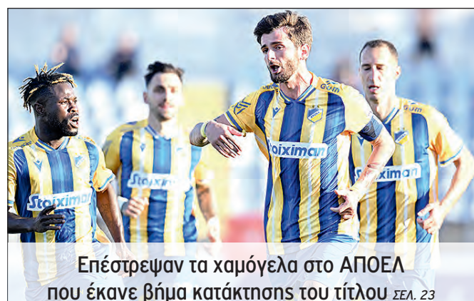
Επέστρεψαν τα χαμόγελα στο ΑΠΟΕΛ που έκανε βήμα κατάκτησης του τίτλου ΣΕΛ. 23

Ο Απόλλωνας θα υποδεχθεί αύριο την Πάφος FC και καλείται να ανατρέψει τα εις βάρος του δεδομένα, ώστε να βρεθεί στον τελικό του Κυπέλλου. ΣΕΛ. 22