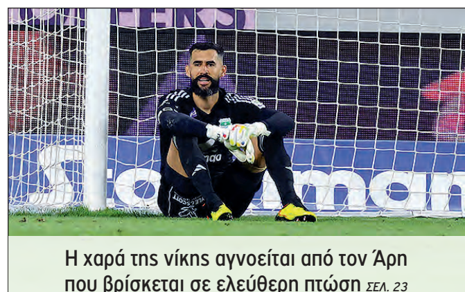
Η χαρά της νίκης αγνοείται από τον Άρη που βρίσκεται σε ελεύθερη πτώση ΣΕΛ. 23