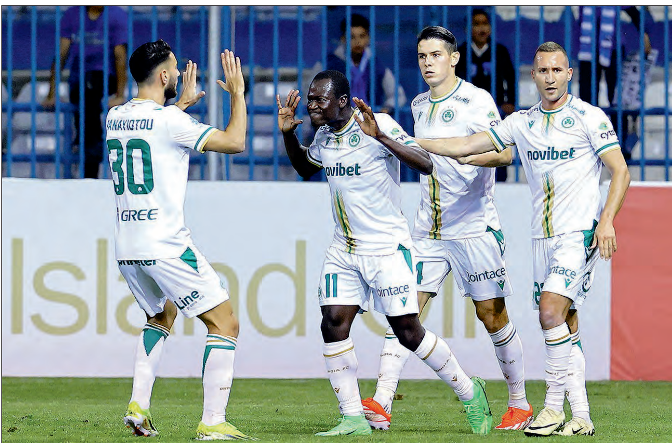
Η Ομόνοια συνεχίζει την ανοδική της πορεία και χωρίς χάσιμο χρόνου προετοιμάζεται για τον αυριανό επαναληπτικό αγώνα με τον Άρη όπου μεγάλος στόχος είναι η πρόκριση στον τελικό του Κυπέλλου. ΣΕΛ. 23